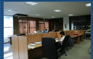
Biblioteca Casa do Brasil

Informamos que de acuerdo con la Ley 28/2005, de 26 de diciembre , medidas sanitarias frente al tabaquismo y reguladora de la venta, el suministro, el consumo y la publicidad de los productos del tabaco, está prohibido fumar en todos los espacios comunes de la Casa do Brasil.