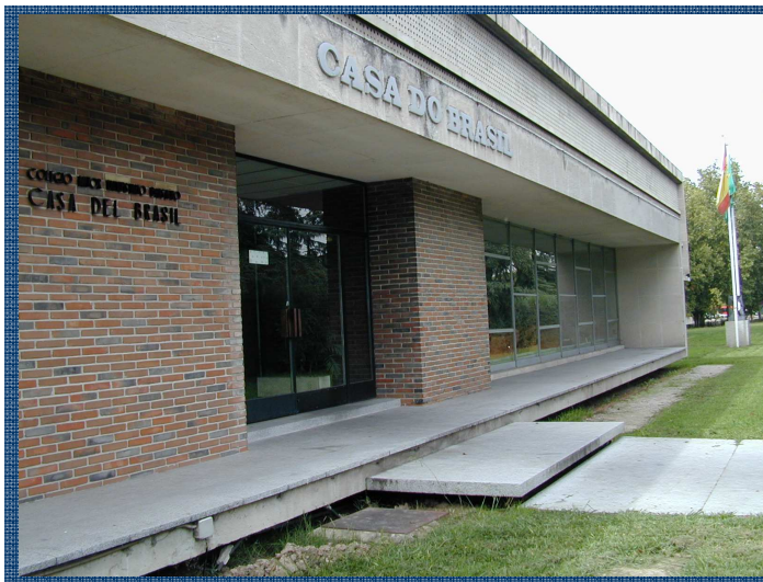
Fachada principal De Casa do Brasil